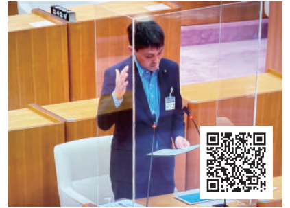
質問する私 ※QRコードより質問動画ご覧いただけます。