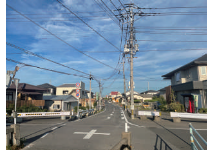
現在の東高木木角線