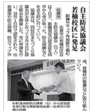
校区においては9月9日に自主防災組織が設立されました。10月10日 新聞記事