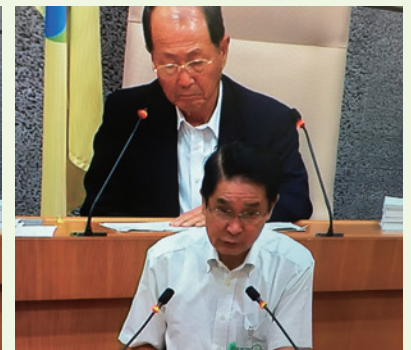
質問する私と、それに対して答弁をする市教育長