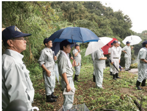
大雨災害現地視察 写真

去る8月27日～28日に、佐賀市は、またしても大雨被害に見舞われました。9月30日には経済産業委員会の委員として被害が甚大であった金立町に現地調査に赴きました。金立町では約750戸が断水となりましたが、佐賀市上下水道局および工事関係者の8月29日から30日にかけての作業努力で約480mの配水管接続を1日で終了し断水は解除されました「自助」「共助」「公助」災害時の対応はどれか一つだけあれば良いという訳ではなく、この全てが大切であると言われています。その意味でも「公助」としての役割をしっかりと果たした今回の上下水道局のように私も「自助」と「共助」の部分での市民としての役割をこれからもしっかりと果たしていきます。