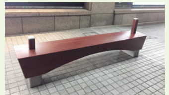
造形アートベンチ (参考資料)