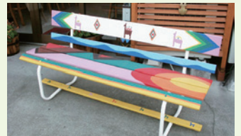
塗装アートベンチ (参考資料)